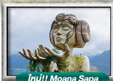
ใหม่!! Moana Sapa