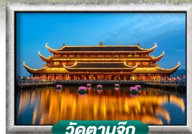
วัดตามจุก